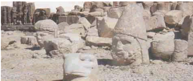
Cabezas de Apolo y Zeus en Adiyamán -Turquía-